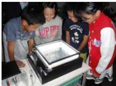
放射線に関する体験型学習の例 (霧箱観察)

放射線、再生可能エネルギー及び自然環境に関する体験型の学習（40分程度）を実施します。実施内容については別紙1「体験研修メニュー」をご覧ください。なお、福島県教育委員会作成の「放射線等に関する指導資料」および福島県生活環境部作成の環境副読本「ふくしまのかんきょう」に沿った学習内容となっています。学習時間等の詳細については、学校のご希望を踏まえ調整します。