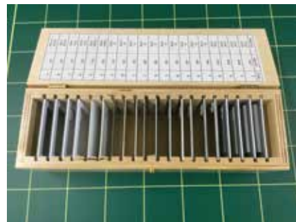
遮へい実験用遮へい板