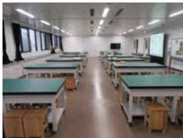
学習会場（約80名収容）