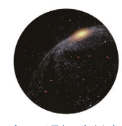
-すべては星から生まれた-