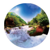
-固有種との出合いの旅-